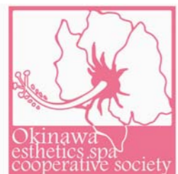
沖縄県エステティック・スパ協同組合

エステティック及びスパは一人 当たりの消費単価が高く、高付加 価値観光メニューの一つとして期 待されています。このため、「沖縄 エステ・スパ」が本県の新たな観光 商品の一つになるよう、県でも支 援を行っています。