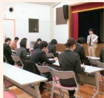
各学校で講座を開催(就活パワフルサポート)

全国一厳しいと言われる沖縄県の雇用情勢の中でも、特に三十歳未満の若年者の失業率は十二・五%(平成二十二年)と高い状況が続いています。 その要因は、就職が決まらないまま学校を卒業したり、卒業後就職しないまま数年を過ごしたりすることであり、そうなるとその後の就職がさらに困難なものになると言われています。沖縄県では卒業を控えた学生の皆さん、就職が決まらないまま卒業することになってしまった皆さんのために各種の支援事業を実施しています。 新規学卒者緊急就職支援プログラム(就活パワフルサポート) 沖縄県は、県内の高校三十六校、大学八校に「専任コーディネーター」を配置しています。専任コーディネーターは、各学校に常駐し、来年三月卒業予定の皆さんの就職をお手伝いします。まず、今年度前半は学校と連携してマナー講座や履歴書の書き方、面接の受け方といった基礎的な講座を行っています。さらに、就職活動終盤となる十月からは、企業開拓を行うとともに、就職面接会を合計九回開催します。面接会前には、企業分析、面接対策などコーディネーターによる個別支援で、内定獲得をバックアップします。 未就職卒業生県外就職支援プログラム 未就職のまま高校・大学などを