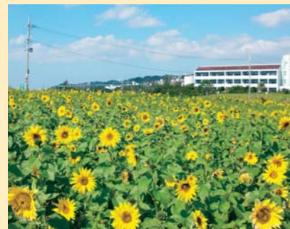
読谷飛行場返還跡地イメージ図

花を増やそう！ 現在、沖縄県では、緑の美ら島の創造を目指し、県民総ぐるみで「全島緑化県民運動」を推進しています。そのため、自らの地域が「花と緑の名所」となるよう、地域住民参加による緑化活動に対して、花木・草花などの苗を提供する「グリーン・コミュニティ支援事業」を展開しているところです。 これまでに約二五〇団体の地域緑化活動を支援しており、特に読谷飛行場返還跡地では、花と緑による地域活性化を図ることを目的に、児童・園児の参加のもと、一、五〇〇人の地域住民により緑化活動が盛大に行われました。六月には、約一三、〇〇〇㎡の広大な土地にヒマワリが咲き誇り、新たな名所として、訪れる人々に潤いと安らぎを与えることとしていっしょう。 国際森林年にあたって、さらなる県土緑化に向けた「三六五日花と緑と香りいっぱいのおもいで島沖縄づくり」を推進してまいります。