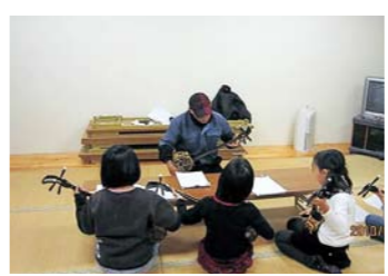
放課後居場所づくり活動