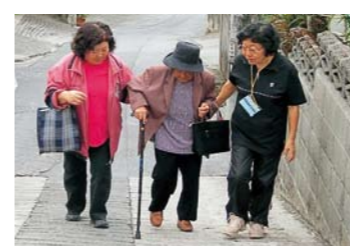
防災訓練・要援護者支援