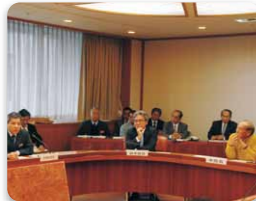
危機管理対策本部会議の様子

県内各地でインフルエンザの患者が急増し、また、他県で高病原性鳥インフルエンザの発生があることを受け、これらに対する各部署の対応を確認するため、沖縄県危機管理対策本部会議を開催した。 会議では、新型インフルエンザおよび口蹄疫の現状や、高病原性鳥インフルエンザの発生状況について報告があり、今後の対応について話しあうとともに、各部署の迅速な対応について確認した。 また、「新型インフルエンザ対策」や「口蹄疫や鳥インフルエンザの対策」について県民に対するメッセージを発し、注意喚起することとした。