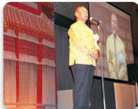
あいさつする仲井真知事