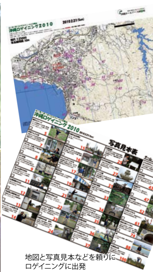
地図と写真見本などを頼りにロゲイニングに出発

がじゅまる自然学校(名護市真喜屋) 地域との絆や信頼関係を大切にしたい さまざまな体験型プログラムを提供したい