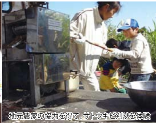
地元農家の協力を得て、サトウキビ刈りを体験