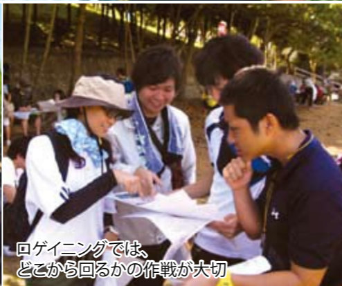
ロゲイニングでは、どこから回るかの作戦が大切