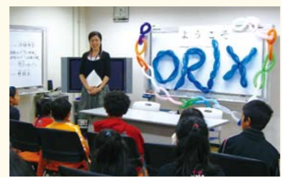
ファミリーオープンハウスデーの様子

また、介護休業中の社員への経済的な支援や、親と子がふれあう交流の場として社員の働く姿を実際に見ることができる「ファミリーオープンハウスデー」(家族参観日)を年に一回実施するな