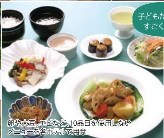
卵や大豆、エビなど、10品目を使用しないメニューを各ホテルで用意