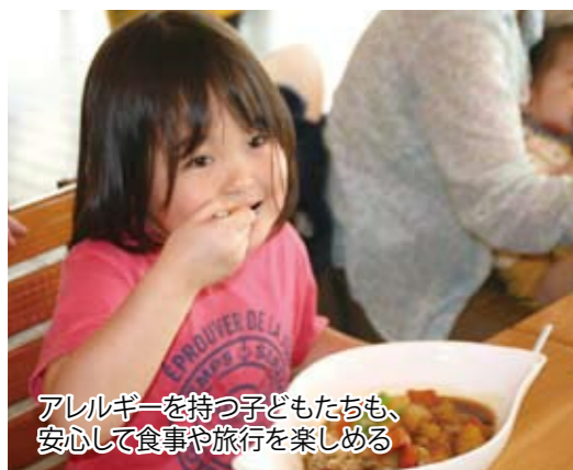
アレルギーを持つ子どもたちも、安心して食事や旅行を楽しめる