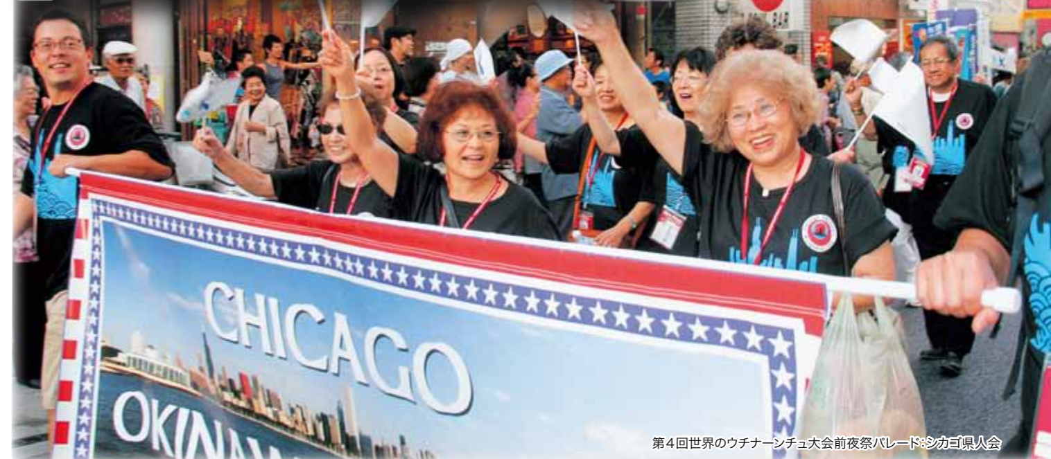
第4回世界のウチナーンチュ大会前夜祭パレード：シカゴ県人会

1世たちは海を越え想像を絶する過酷な状況の下で懸命な努力を続け、ひとつの時代を乗り越えた。 2世たちは1世の後姿から多くのことを学び、前進・奮起して次の世代のための足場を固めた。 そして、ウチナーンチュのアイデンティティーが、3・4・5世へと引き継がれ、 第1回大会開催から20年の時を超え、来年、第5回世界のウチナーンチュ大会が開催される。