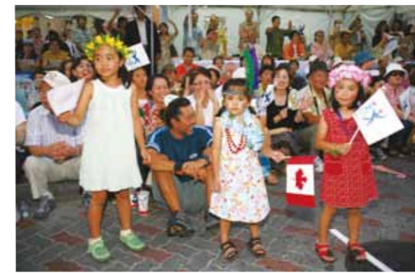
第4回世界のウチナーンチュ大会前夜祭パレード：県民による歓迎

「世界のウチナーンチュ大会」とは 沖縄県では、世界に雄飛し、活躍している県系人を沖縄の貴重な人的財産であると考えており、若年層の交流のための「ジュニアスタディーツアー」「ホストファミリーバンク推進事業」など、ウチナーンチュネットワークを担う世代を育成するための事業に取り組んでいます。 戦後における沖縄の復興と今日の発展は、これらの海外移民の支援なしには考えられません。