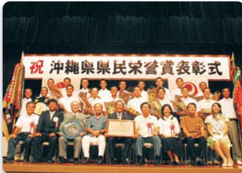
県民栄誉賞を受賞した興南高校野球部の皆さん

第92回全国高校野球選手権大会で県勢として初めて優勝し、史上6校目の春夏連覇を果たした興南高校野球部に対する「沖縄県県民栄誉賞表彰式」が県庁講堂で行われた。