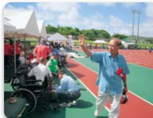
選手・関係者を激励する仲井眞知事

第46回沖縄県身体障害者スポーツ大会が沖縄県総合運動公園で開催された。各福祉地区や施設から選手約700人が参加し、陸上、卓球、水泳、フライングディスクが行われた。