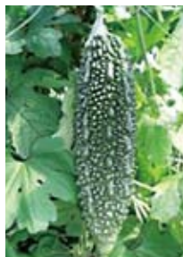
「夏盛」(左) 紡錘形、濃緑色、イボは鋭い。 施設栽培用。収穫: 5月~10月

【ゴーヤーの種類】 「夕風」は、ずんぐりとした形で、イボも丸みを帯びた「アバシー」以外に、「群星」「夕風」「島風」「夏盛」などの品種があります。県では「夕風」「夏盛」の生産に力を入れています。 (主な特徴) 「群星」: 紡錘形、濃緑色、イボは鋭い。施設栽培用。収穫は三月~十月 「島風」: 紡錘形、濃緑色、イボは少し丸みを帯びる。露地栽培用。収穫は四月~十月