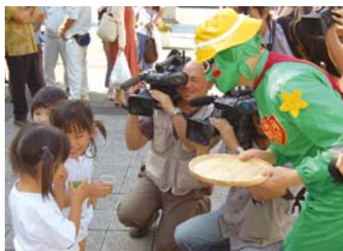
ゴーヤーの日イベントの様子

イベント問い合わせ 沖縄県農林水産物 販売促進協議会 (事務局・流通政策課内) ☎098-866-2255