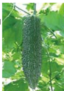
「夕風」(右) 紡錘形、濃緑色、イボは鋭い。 施設栽培用。収穫: 9月~10月

【ゴーヤーの産地・収穫量】 ゴーヤーは県内各地で生産されていますが、特に今帰仁村、糸満市、名護市、豊見城市、宮古島市などで多く生産されています。県全体での作付面積は三百六十八ヘクタール、奥武山総合運動公園の約十五個分です。収穫量は平成十五年以降毎年八千トンを超えています。 沖縄の温暖な気候はゴーヤー栽培に適し、年間を通して生産されています。冬春期の本土市場では、沖縄産ゴーヤーがそのほとんどを占めています。