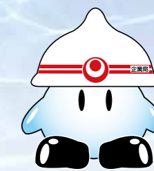
県企業局キャラクター「水道マン」

県企業局では水道用水供給事業を行っています。この事業は、市町村等へ水道用水を広域的に供給するもので、いわば、水の卸売業の役割を果たしています。家庭や学校などの地域社会に直接給水を行うのは市町村の事業です。