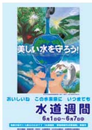
H21年度水道週間ポスター

沖縄県企業局では、水道週間行事の一環として北谷町にある北谷浄水場・海水淡水化センターの一般公開を行います。安全でおいしい水がどのようにしてつくられているか、楽しく見学することができます。ウォークラリーや利き水のほか、職員有志によるバンド演奏も行われます。入場は無料でどなたでも見学することができますので、ぜひ、この機会に水道施設をご覧ください。