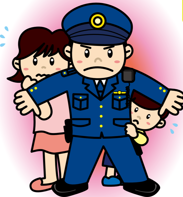
※JWAT(じえいわつと) : Juvenile and Woman Aegis Team ◎ juvenile【意味】少年、少女、年少者 ◎ Aegis【意味】保護、後援、後ろ盾

沖縄県警察は、子どもと女性を性犯罪等の被害から守るため、昨年四月一日、警察本部内に『子ども・女性安全対策係(※JWAT)』を設置し、子どもや女性を対象とする性犯罪の前兆とみられる声かけ、つきまとい等について捜査を行い、犯人(行為者)を特定して検挙または指導・警告を専門的に行っています。 今回は、子どもや女性を対象とする性犯罪等の県内での発生状況と、県警察における先制・予防的活動の内容について紹介します。