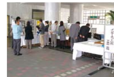
公売物件の下見会の様子

財産を公売されるなんてかわいそうと思われるかもしれませんが、しかし、県民の95%以上の方は、きちんと納税しています。残りの5%の中には、資力がありながら払わない人がいます。資力がありながら納税意識に欠ける滞納者については、財産調査を行い、差し押さえを執行して、売却(公売)し、滞納税額へ充てます。これにかかる人件費等の費用は、真面目に納めた納税者の税金から支出されているのです。