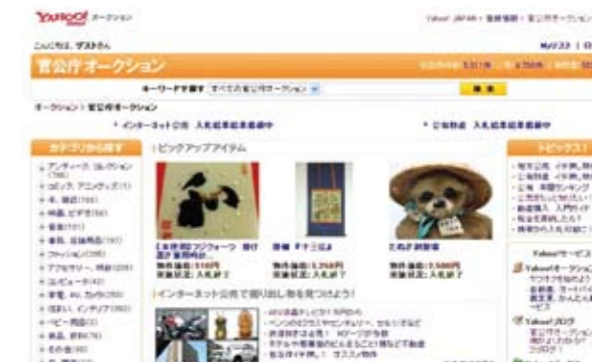
官公庁オークションの画面