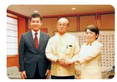
握手を交わす仲井真知事と福島大臣

就任後、初来県した福島みずほ少子化対策担当大臣は県庁を訪ね、仲井真知事と沖縄の子育て支援対策について意見交換した。