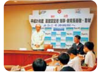
歓迎のあいさつをする仲井真知事

仲井真知事は「米軍普天間飛行場は街の中心部にあり、航空事故による米軍機の墜落などの危険があるほか、周辺に住む住民の生活を脅かしている騒音問題もあるので一刻も早い移転が必要だ」と答えた。