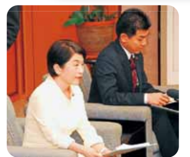
県側の説明に耳を傾ける福島大臣

これに対し、福島大臣は「沖縄の実情に合わせた待機児童の解消をぜひやりたい」と話し、全国トップとなっている沖縄の保育所待機児童の解消や認可外保育施設の認可化に対する条件の緩和、同施設に対する支援など、沖縄独自の子育て支援策に積極的に取り組む考えを示した。この後、福島大臣は浦添市内の認可外保育施設などを視察した。