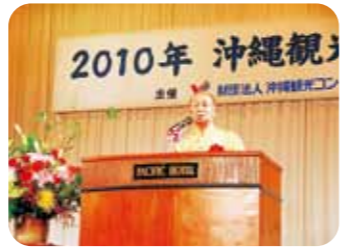
あいさつする仲井真知事

仲井真知事は来賓あいさつで「観光客数1千万人、観光収入1兆円を実現するためにも業界と県が一体となり、沖縄の魅力が詰まった観光を支援していくことが重要だ」と話した。