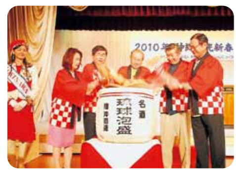
鏡割りを行う仲井真知事ら

沖縄観光コンベンションビューロー（OCVB）主催の「2010年沖縄観光新春の集い」が那覇市内のホテルで開催され、観光業界や行政関係者など約1,100人が参加し、官民一体による沖縄観光の飛躍を目指す決意を新たにしました。