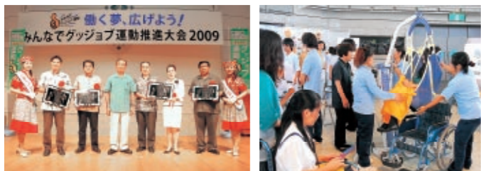
グッジョブ運動推進功労者表彰