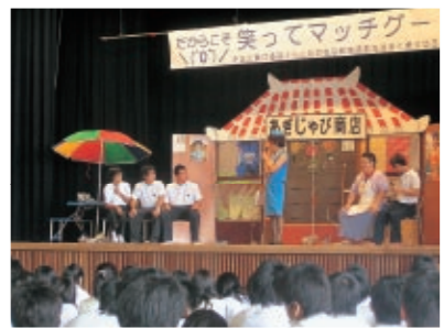
おでかけお笑いマッチグーの様子

演芸集団FECのメンバーが、高校・大学・専門学校などを訪問して、雇用の現場で起きているミスマッチをコント上演します。開催校・開催団体募集中！です。