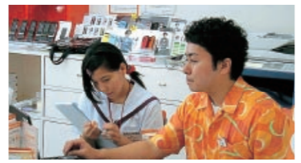
ジョブシャドウイングの様子

ジョブシャドウイングは、キャリア教育の新しい手法です。働く大人に影のように寄り添って観察し、その働く姿勢から生徒達が仕事の楽しさ、働くことの意義、職種に関する知識を身につけることで、社会の仕組みへの理解を深め、将来の夢や進路を考えるきっかけを作ります。