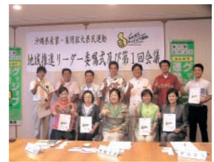
第二期地域推進リーダー

県は、各地域に密着したグッジョブ運動を展開する第二期地域推進リーダーを12名に委嘱しました。