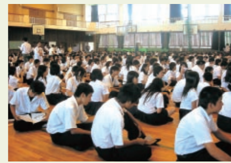
豊見城南高校での講座の様子

と「人を尊重すること」を意識し、自分のできることを考えてもらうための取り組みとして、ワークシートの記入も行ってもらっています。