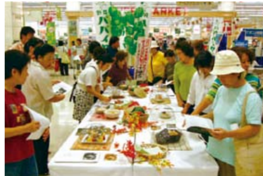
昨年のキャンペーンの様子

公立小中学校の学校給食に野菜パイヤを積極的に取り入れてもらう取組みや県庁地下二階の食堂において野菜パイヤメニューを使ったヘルシーメニューの提供などを行いました。