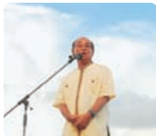
会場であいさつする仲井眞知事

同まつりは11日の道じゅねーに続いて、12日と13日には市内青年会のほか、市外青年会など総勢28団体が出演し、それぞれ特色ある力強い演舞を披露した。