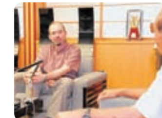
米軍再編について展望を語るグリーン総領事

「目標としている2014年までに普天間代替施設だけでなく、嘉手納基地より南の軍用地等の土地返還なども含めた計画を実現させたい」として、在日米軍再編について展望を語ったグリーン総領事に対し、仲井眞知事は「米軍再編については早急に計画を進めて欲しい」と話したほか、米軍関係者の事件・事故および騒音問題について改善に取り組むよう求めた。グリーン総領事は「対策について積極的に意見交換するなど、対話で問題解決できるよう努力したい」と応じた。