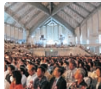
開会式に参加した全国PTA関係者

大会2日目は県内各地で複数の分科会に分かれ、家庭・学校教育や進路等について討議を深めた。