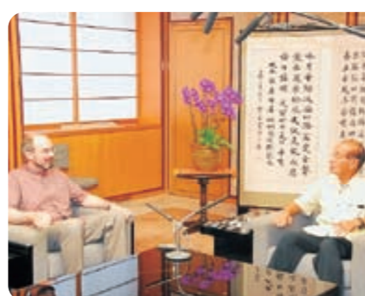
米軍基地に関する問題について改善を求める仲井眞知事(右)

前職のケビン・メア氏に代わり、8月25日付で在沖米国総領事に着任したレイモンド・グリーン氏が着任あいさつで県庁を訪ね、仲井眞知事に県幹部を表敬した。