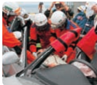
事故車両からの救助活動訓練の様子

同訓練は宮古島近海を震源とする強い地震により、多良間島で震度6強、宮古島市平良地区で震度6弱を記録し、津波の発生や多数の建物の倒壊などを想定した消火活動のほか、事故車両や倒壊した建物からの救助活動、災害後の復旧活動などが行われた。