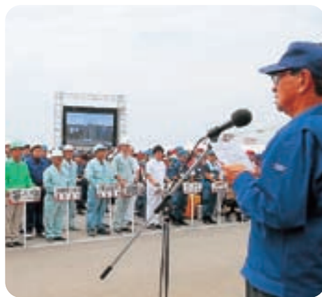
参加者を前にあいさつを述べる仲井眞総監

県、市町村及び各防災機関の連携と県民の防災に対する意識向上を目的とした平成21年度の県総合防災訓練が宮古島市の平良港下崎ふ頭で行われ、消防や警察、自衛隊のほか、地元住民・生徒、関係団体の職員など約2,000人が参加した。