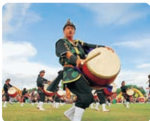
会場に太鼓の音が響き渡るエイサー演舞

第54回沖縄全島エイサーまつりが沖縄市のコザ運動公園陸上競技場で行われ、県内外から集まった多くのエイサーファンが県内各地青年会のエイサー演舞を楽しんだ。