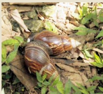
アフリカマイマイ