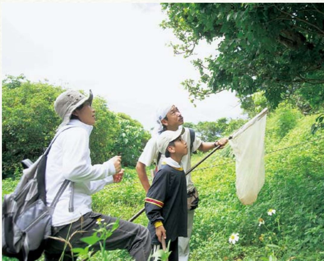
目を凝らしてみると、森の中