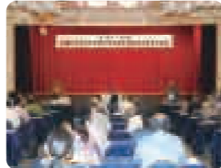
緊急総会にて決議を採択

仲井真知事ら要請団は13日に上京し、法案の審議に係る国会議員等を訪ね、要請を行った。