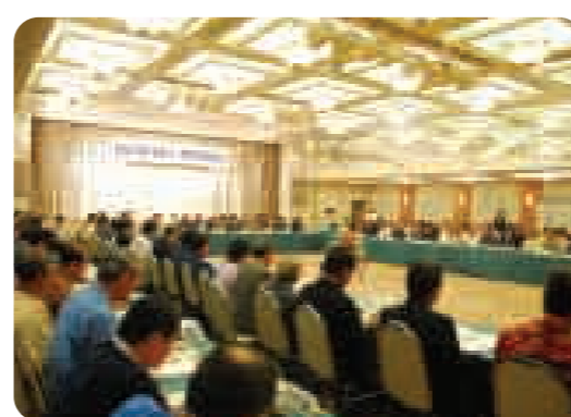
県・市町村行政連絡会議の様子

平成21年度の県・市町村行政連絡会議が那覇市内のホテルで行われ、仲井真知事をはじめ、県幹部と市町村長、議長らが出席し、様々な議題について議論した。