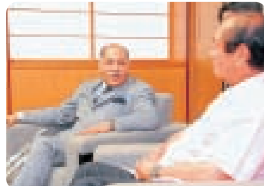
仲井眞知事と懇談するドウラ大使

駐日 Bangladesh 大使のアシュラフ・ドウラ氏が県庁を訪ね、仲井眞知事を表敬した。