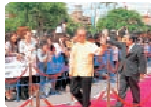
野国北谷町長(右)とレッドカーペットを歩く仲井眞知事

「Laugh&Peace(笑いとお平和)」をテーマにした沖縄国際映画祭2009が北谷町美浜のアメリカンビレッジで開幕した。