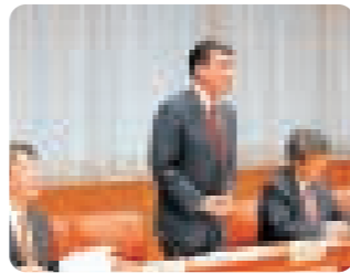
あいさつする河野委員長

会談の中で仲井眞知事は同委員会に対し、在日米軍再編による県民の負担軽減や日米地位協定の抜本的な見直しなどを盛り込んだ7項目について要請した。