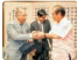
仲井眞知事から記念品を贈呈

これに対し、仲井眞知事は「Bangladesh 国と沖縄の交流を深めていくためにも Bangladesh 国からぜひ多くの人材を沖縄に招きたい」と述べ、協会設立について協力する姿勢を示した。