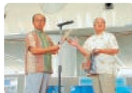
宮里理事長(右)とかりゆしウエアをPRする仲井眞知事

毎年恒例となっている「かりゆしウエア着用キャンペーン」セレモニーが県庁1階の県民ホールで行われた。