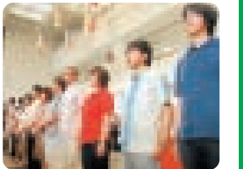
観衆の前に披露された新作かりゆしウエア

セレモニー終了後に開催されたファッションショーでは県職員らがモデルを務め、新作46点のかりゆしウエアを披露した。