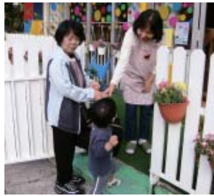
提供会員(まかせて会員)による保育所への送り

育児の手助けをして欲しい方で、育児の手助けをしたいと思っっている地域の人が会員となって行う有償ボランティアのしくみです。