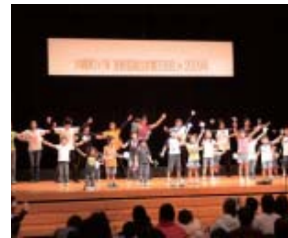
会員新春交流会 in 2009