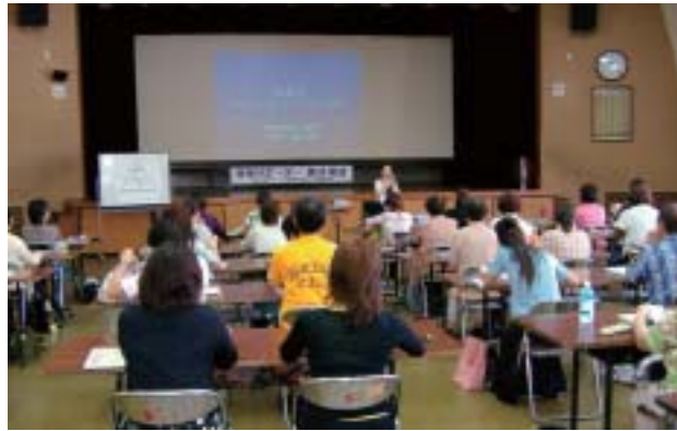
提供会員養成講座

現在、県内九カ所のセンターで盛んに活動が行われています。育児のために就職や趣味をあきらめている方、自分の能力や経験を生かしてみたい方、ぜひこの機会に会員として登録してみませんか?