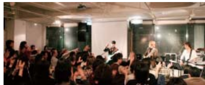
那覇市内ライブハウス