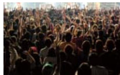
沖繩市・ミュージックタウン音市場

クやポップスを中心に、民謡やアジアの伝統音楽まで、まさに「チャンネル」な音楽のお祭りです。同時に、音楽産業の発展を目指すセミナーやカンファレンスも開催