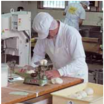
実技試験風景その2 (パン製造職種)