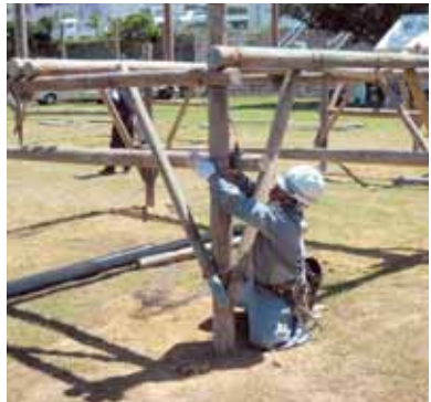
実技試験風景その1 (とび職種)

級に区分しないで行われるもの(単一等級)、このほか外国人を対象として行われるもの(基礎級)があります。