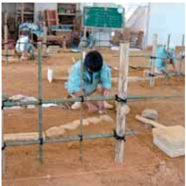
実技試験風景その3 (造園職種)

県では平成二十一年二月現在までに計一六、三六三名の技能士が誕生し、衣・食・住の様々な分野で活躍しています。