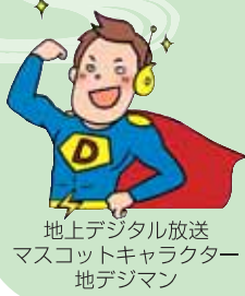
地上デジタル放送 マスコットキャラクター 地デジマン

現在の地上アナログ放送は二〇一一年七月二十四日に終了し、地上デジタル放送(地デジ)に移行することになっています。地デジ移行後、テレビ放送を視聴するためには、視聴者側で地デジ対応テレビまたはデジタルチューナーを購入するなどの準備が必要となりますが、各放送局(送信側)も地デジに対応した施設整備などが必要となります。