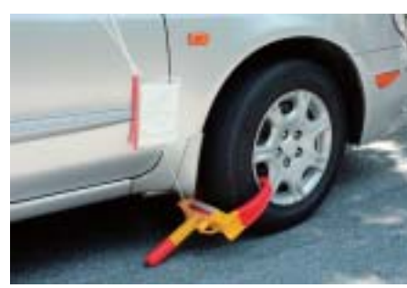
タイヤロックされると、車の運行ができなくなります。

① 預貯金、給料・ボーナス等の差し押さえを行います。 ② 滞納者の所有する自動車にタイヤロックを実施します。 ③ 滞納者の自宅等で差し押さえ可能な財産を捜索します。 ④ 差し押さえた財産を公売し、落札代金を滞納者の税金に充てます。