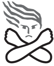
女性に対する暴力根絶のためのシンボルマーク

女性に対する暴力の問題に関する取り組みを一層強化し、女性の人権の尊重のための意識啓発や教育の充実を図ることを目的としています。