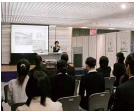
EXPO2008会場でのプレゼンテーションの様子