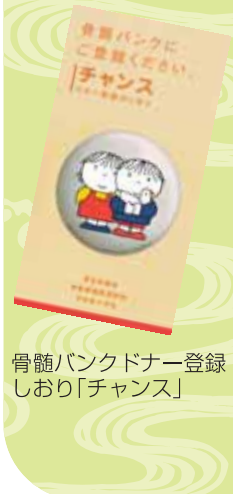
骨髄バンクドナー登録しおり「チャンス」

県では、広く県民の皆様に移植医療の現状を知ってもらい、臓器移植・骨髄移植の一層の定着・推進を図るため、推進月間期間中に様々なイベントを行います。