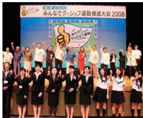
参加者全員による県民宣言