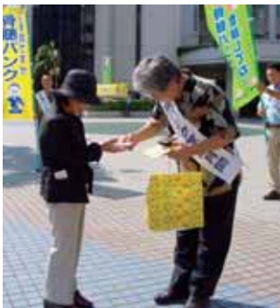
骨髄バンク街頭キャンペーン(2007)