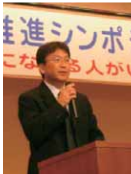
臓器移植普及推進シンポジウム(2007)