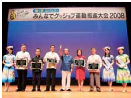
グッジョブ表彰受賞者

に対するアピールや、「沖縄の雇用どうする？」私の役割、あなたの役割を考える」をテーマとした企業経営者らによるトークセッションを実施し、最後に参加者全員による県民宣言で閉会しました。また、沖縄産業支援センターでは「グッジョブEXPO2008」が開催され、仕事体験や企業ブラス出展、仕事の魅力を紹介するプレゼンテーションが行われました。