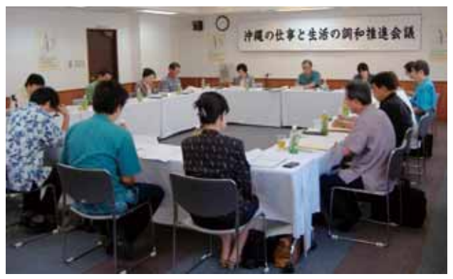
沖縄の仕事と生活の調和推進会議

沖縄労働局では、労使をはじめ地方公共団体、学識経験者等に幅広く意見を求め、仕事と生活の調和の実現についての理解と関係者相互の合意形成の促進を図るため、「沖縄の仕事と生活の調和推進会議」を設置しています。