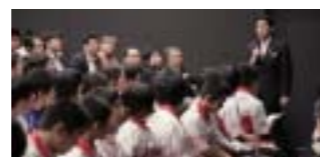
フォーラム(大臣と生徒との交流)