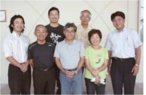
宜野座村文化のまちづくり事業実行委員会のみなさん

宜野座村文化センターは、文化のまちづくりの拠点として二〇〇三年四月にオープンしました。同センターの劇場棟、通称「がらんホール」は約四〇〇人が収容可能。これまでにコンサートや映画上映、村内カラオケ大会など、さまざまな催し物が企画、運営されています。