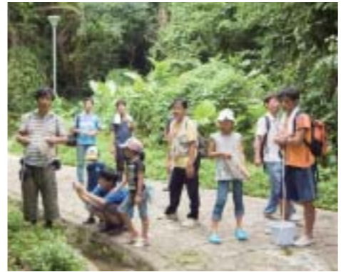
側溝に注ぎ込む湧水を利用して、せせらぎと水たまりのビオトープを作ります。まずはイメージ作りから

二〇〇八年四月、沖縄自然環境ファンクラブは、那覇市公園管理室と協働で「末吉公園みんなのビオトープ整備事業」をスタートさせました。同事業は、遊歩道の側溝に流れ込んでいる湧水を利用して、せせらぎと水たまりのビオトープをつくろうというものです。「今、身近な自然がどんどん減っています。自然を守るために具体的に何ができるか考えたとき、末吉公園内の湧水を生かして、生き物が棲めるような水辺環境を復元させるというアイ