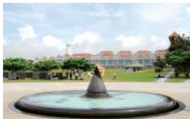
平和祈念資料館と平和の光