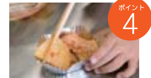
ポイント4 アルミカップに3のじゃがいもと豚肉を交互に重ねて入れ、トマトソースをかける。