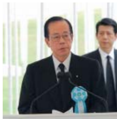
あいさつを述べる福田首相

式典終了後は、一般焼香が行われ、参列者が先の大戦で亡くなられた戦没者の御霊に手を合わせ、ご冥福をお祈りしました。