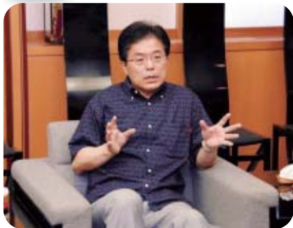
仲井眞知事と面談する増田総務大臣

現 場視察や地方の意見を聞く「増田大臣とのくるまざ対話」が石垣島で開催されるため、来県した増田寛也総務大臣は石垣入りの前に県庁を訪ね、仲井眞知事と面談した。