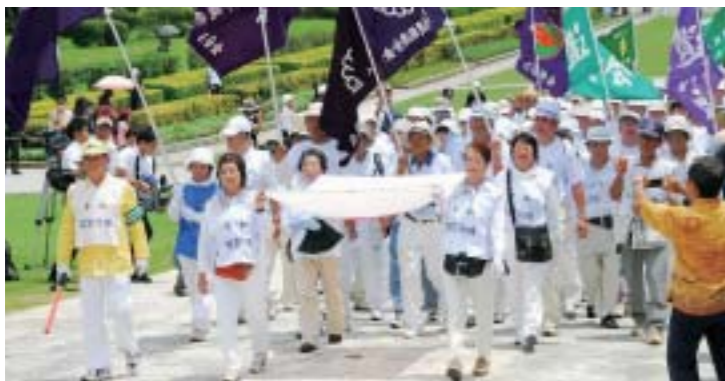
平和祈願慰霊大行進の様子

二十三日当日は沖縄県遺族連合会が主催する平和祈願慰霊大行進が行われ、炎天下の中、約八百人が糸満市役所から追悼式典会場までを徒歩で行進し、平和への誓いを新たにしました。