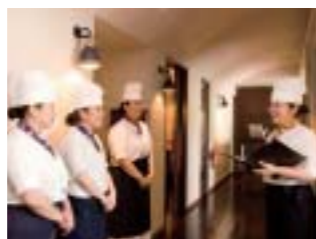
ミーティングでは予約状況などを確認

いつも明るくてやさしい外間店長は、朝夕のミーティングもテンションが高いんです(笑)。だからおもろまち店には常に笑いがあります。トレーナーとしての調理の指導も愛情いっぱい、年齢も近いので話しやすいですね。ありあわせの素材で作るまかない料理もセンスが良くてすごくおいしい。「店長、今度うまく作るコツを教えてくださいね!」