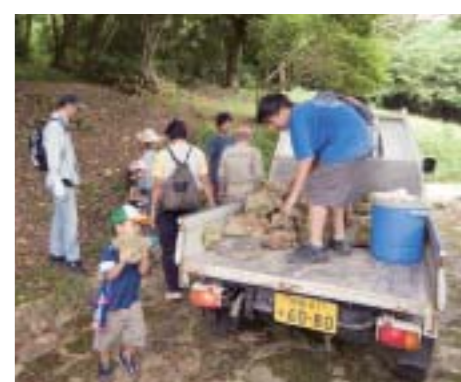
「末吉公園ビオトープ作り、石集めとイメージ作り」で、公園内の石を集めました

二〇〇八年四月、沖縄自然環境ファンクラブは、那覇市公園管理室と協働で「末吉公園みんなのビオトープ整備事業」をスタートさせました。同事業は、遊歩道の側溝に流れ込んでいる湧水を利用して、せせらぎと水たまりのビオトープをつくろうというものです。「今、身近な自然がどんどん減っています。自然を守るために具体的に何ができるか考えたとき、末吉公園内の湧水を生かして、生き物が棲めるような水辺環境を復元させるというアイ