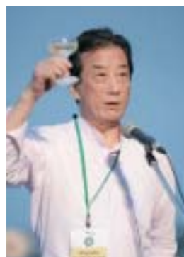
黒川内閣特別顧問