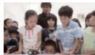
ロボットの組立実験

会合翌日の六月十六日には、県立博物館・美術館において大臣会合参加者や県内の小中高生が参加した科学実験体験やフォーラムが行われました。