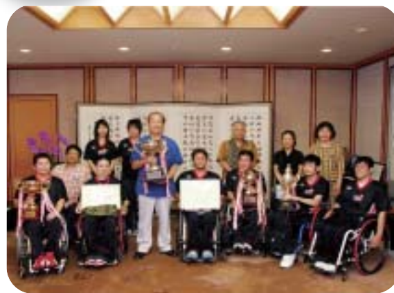
仲井眞知事と沖縄フェニックス選手一行

沖 縄県で開催された厚生労働大臣杯争奪第22回日本車椅子ツインバスケットボール選手権大会で五年ぶり三度目の全国制覇を果たした県代表チーム「沖縄フェニックス」の選手や関係者が県庁を訪れ、仲井眞知事に大会優勝を報告した。