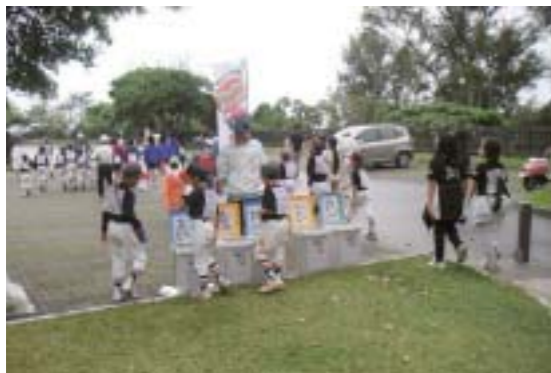
クリーンアップキャンペーン

また、観光地の環境美化と地域住民の美化意識の向上を目的に、毎月二十二日をめんそーれ沖縄クリーンアップキャンペーンの日と定め、各地域、会社での清掃活動を呼びかけており、八月第一週目の「観光週間」では「ALL OKINAWA クリーンアップ」を開催し全県的な清掃活動を行っています。併せて、県内で開催される各ウォーキング大会では、健康と環境美化を結びつけたクリーンアップキャンペーンを開催しています。