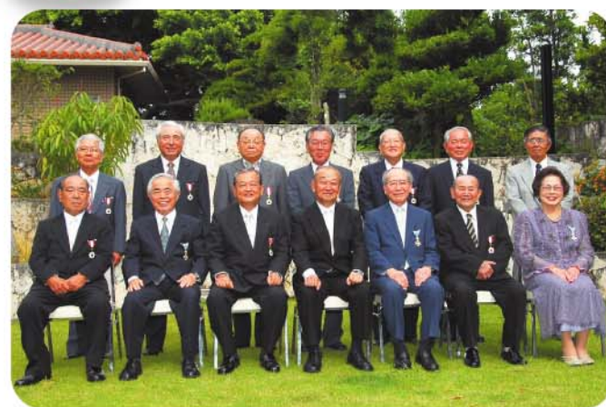
平成20年春の叙勲受章者

平 成20年春の叙勲伝達式が那覇市の知事公舎で行われ、地方自治、保健衛生、社会福祉の各分野における活動の功績を認められた14人の受章者が、仲井眞知事から勲記と勲章の伝達を受けた。