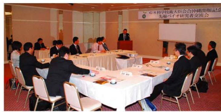
【先端バイオ研究者交流会】