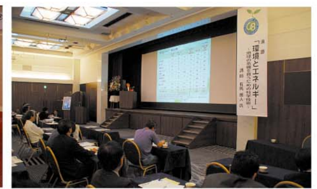
講演会 テーマ：「環境とエネルギー ～地球の危機を救うための科学技術～」

お問い合わせ【G8科学技術大臣会合沖縄県支援本部】TEL.098-866-2561 FAX.098-866-2562