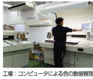
工場：コンピュータによる色の数値管理