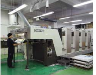
工場：印刷時の色味確認