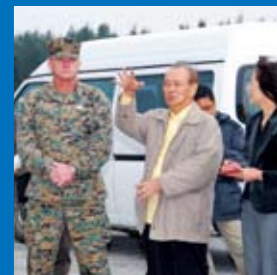
伊江島補助飛行場の現状説明

の要望事項五件と、県からの派遣獣医師の存続など住民からの要望事項四件が出され、地域の住民の方と意見交換を行いました。翌日、新たな観光スポットとして期待される約六百五十種類の花が咲くハイビスカス園を訪問し、伊江村での知事視察広聴を終えました。