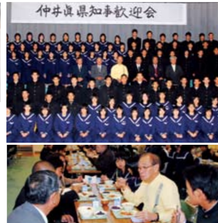
伊江島中学校訪問