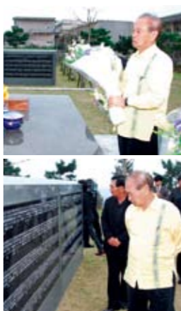
芳魂之塔の参拝・献花

短い時間ではありましたが、直接地域の住民の方とお会いし、意見をうかがう良い機会となりました。