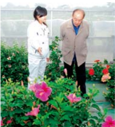
ハイビスカス園視察