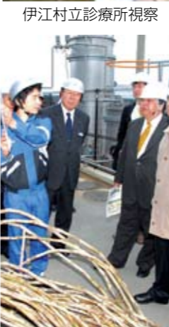
伊江村立診療所視察