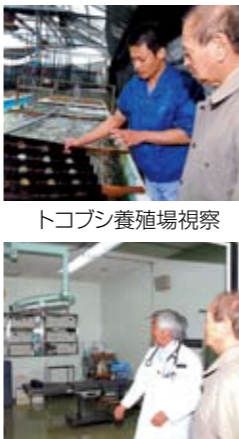
トコブシ養殖場視察