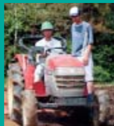
トラクター実習(野菜コース)

「農業を本格的に始めてみたいけれど、やったことがない...」「もっと技術を磨きたい」そんなあなたの希望にこたえる学校が、県内にあります。