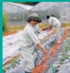
サイヤインゲンのかん水作業(野菜コース)