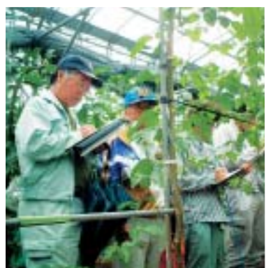
先進農家視察(果樹コース)

そこで、農業大学校ではこれらの声にこたえて新たな取り組みを昨年度から始めています。その一つとして、一年間の「短期養成科」