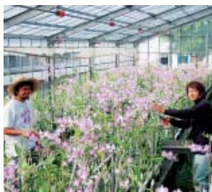
デンファレの収穫作業(花きコース)

卒業生は地域に戻り、農業大学校で学んだ知識と技術を活かして農業経営を行いながら、青年農業