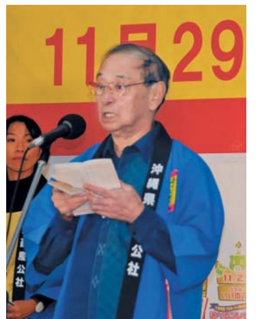
仲井眞知事のあいさつ

キャンペーンでは、仲井眞知事と関係者全員で「うちな〜いい肉の日」宣言をした後、来場者に無料で県産豚肉「あぐー」の丸焼きが振る舞われた。