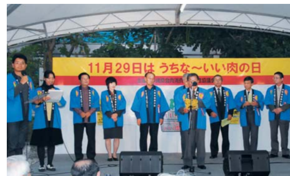
「うちな〜いい肉の日」宣言

県や農業団体、畜産振興基金公社、養豚振興協議会、食肉連絡協議会などで構成される沖縄県食肉消費拡大推進協議会が、11月29日を「うちな〜いい肉の日」と制定し、県庁前の県民広場で「第1回県産食肉消費拡大キャンペーン」を行った。