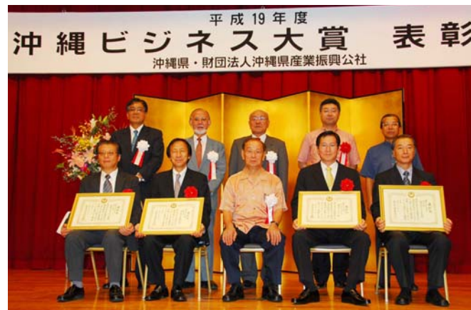
沖縄ビジネス大賞表彰式

県内で独創的な商品開発や経営等に取り組む企業に贈られる平成19年度沖縄ビジネス大賞の表彰式が、那覇市内のホテルで行われ、仲井眞知事から賞状と記念品が手渡された。