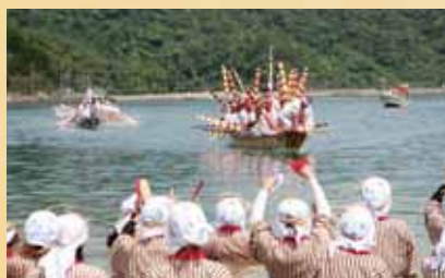
塩屋湾のウングミ(旧盆明け)

正時代のコンクリート造りの公共建造物として、県内に現存する唯一のものとなっています。