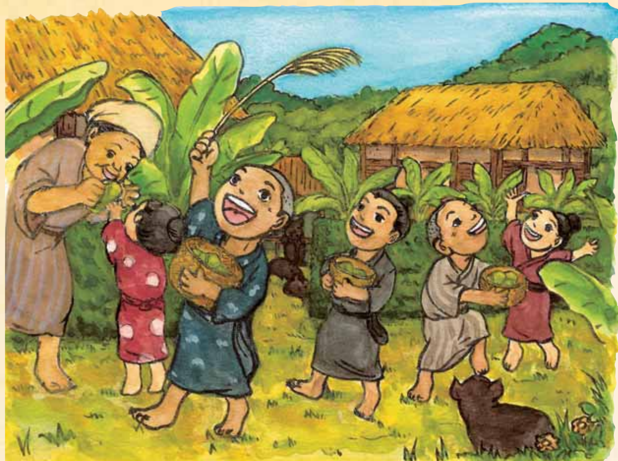
集落の中を唄いながら鬼餅(ムーチー)をもらって歩く子どもたち