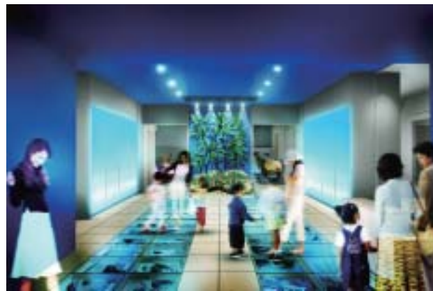
博物館常設展イメージ

博物館 県民のみなさんのニーズに対応するため、総合博物館として、自然史、考古、歴史、民俗及び美術工芸などの調査研究、収集、保存、展示を行います。 常設展では「海と島に生きるー豊かさ、美しさ、平和を求めてー」をメインテーマに、海にかこまれた島々からなる沖縄の自然、歴史、文化を紹介していきます。 ●開館記念展 「人類の旅〜港川人の来た道〜」 人類のルーツと進化をたどる「人