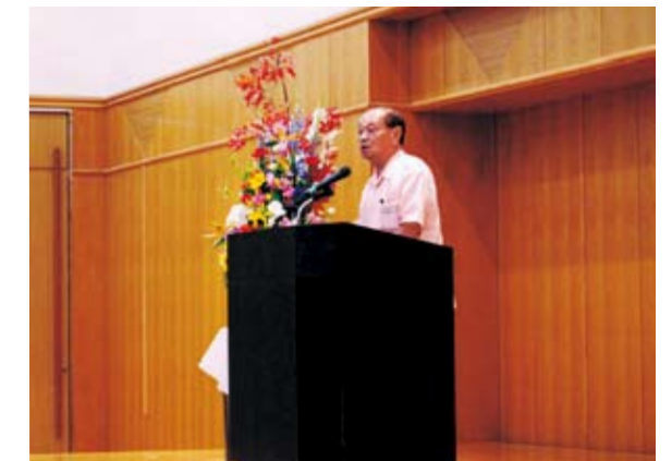
仲井眞知事のあいさつ

仲井眞知事は「観光振興にとって、那覇空港の整備は非常に重要であり、早めに滑走路を増設して新時代に向けたスタートを切りたい」とあいさつした。