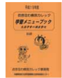
学習メニューブック