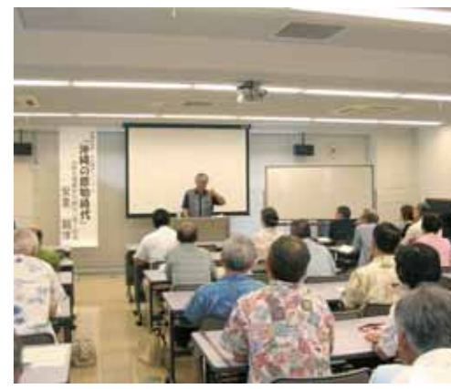
沖縄の歴史・文化講座「原始時代の沖縄」

お問い合わせ【県教育庁生涯学習推進センター】 TEL:098-864-0474 FAX:098-864-0476