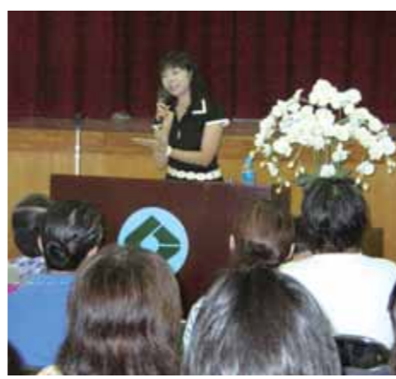
「読み聞かせの大切さ」