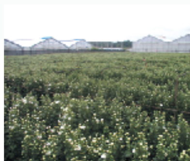
小菊の栽培が盛んに行われている。

全力を出し切って、満足げなハーリーシンカたち。これから漕ぎ手を先頭に、揃ってハーリー歌をうたいながら坂道を上り、ムートゥヤー回りを行ないます。