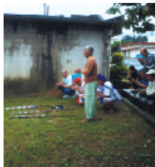
公民館前のトゥマンザ(十座)でウガンの後、くじ引き競漕のコースを決めます。

満潮に合わせ、ウガンバーリーを皮切りに、さまざまな競漕が行われ、潮が引き出す前に全プログラムを終えます。その後は、集落内のムートゥヤー回りや公民館での懇親会など、終日祭りムードでにぎわいます。昔はウミンチュが多かったのでハーリー舟の操作も慣れたものですが、現在では事前の練習が欠かせません。また、十二、三年前からは、真壁小学校の子供たちもハーリーに参加するようになりました。名城では、老いも若きも心をついに、神事と娯楽の両面を持つ、この伝統行事の継承と発展に努めています。