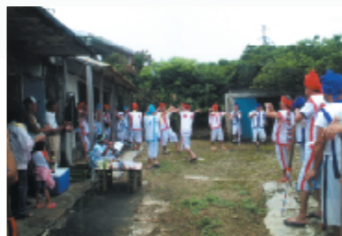
ムートゥヤー回りでは、漕ぎ手たちでハーリー歌をうたいながら、円