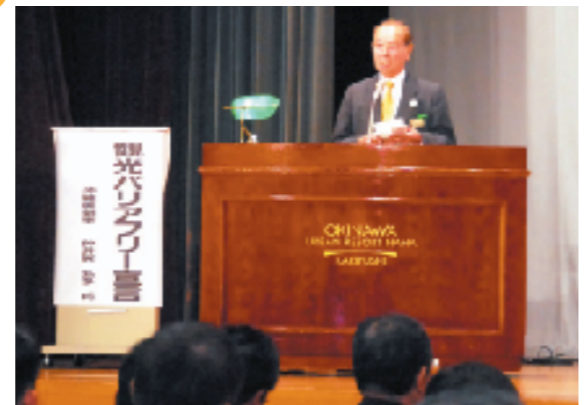
フリー化推進の中核を担う組織の設立の報告、パネルディスカッションが行われた。