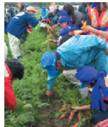
キャロット収穫バスツアー

地産地消とは「地場生産・地場消費」を略した言葉で「地元でとれた生産物を地元で消費する」を意味します。地産地消には主に三つの利点があります。まず一つ目は、生産者と消費者の距離が縮まることで、お互いを意識した情報の交流が図られます。二つ目は、より新鮮で季節に合った旬の味が楽しめる、地元ならではの野菜や果物を食することができる。三つ目は、地元で販売するため、輸送時に生じる二酸化炭素の削減や梱包を簡単にすまされるなど、エコライフにつながります。 フェスティバルでは、見て触れて味わいながら、花、野菜、肉、魚などの県産農林水産物の情報を知ることができ、花と食をとおして健康的な生活を楽しむために、ぜひフェスティバルで地産地消を体験してください。