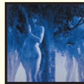
美術 島袋 洋 「私の妻は木であったⅢ」