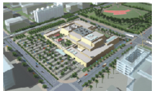
那覇市おもろまち総合公園隣り

沖縄の新たな文化発信・芸術創造の拠点を目指し、今年11月那覇市「おもろまち」に県立博物館・美術館がオープンします。城(グスク)をイメージした地上4階・地下1階の施設では、魅力あふれる収蔵品の数々をご覧ください。