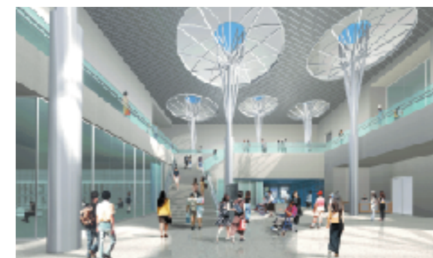
クバの木をイメージしたエントランス「木陰の庭」

お問い合わせ 県文化施設建設室 TEL:098-864-0344 FAX:098-864-0599