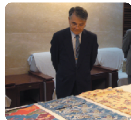
琉球王朝時代の献上品(故宮博物院)