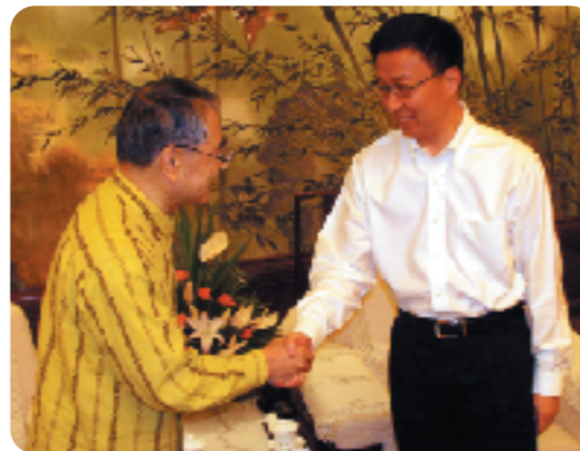
上海市人民政府 韓正市長との会見