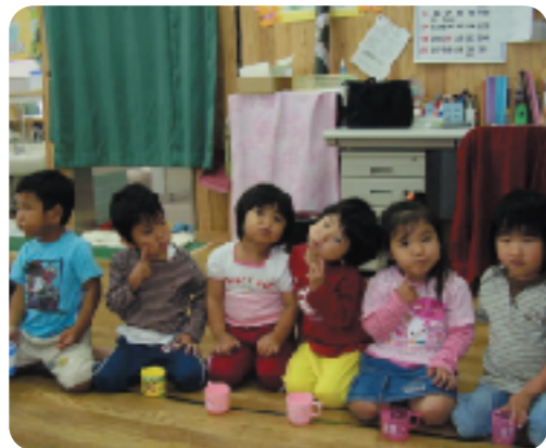
保育園でのフッ化物洗口

歯ブラッシング 県ではフッ化物応用(フッ素 キヤッチコピー)を決定しました! 歯磨きだけでなく、フッ化物を上手に取り入れて、効果的にむし歯を予防しましょう。