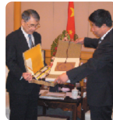
国家文物局 張栢副局長との会見

● 政府要人との会見 知事一行は、中国政府、上海市人民政府などの政府要人と相次いで会見し、観光誘客をはじめ、琉球文化公開などを推進するための意見交換を行いました。その中で、中国からの観光誘客に関する提案や上海ー沖縄直行便の増便の可能性が示唆されるなど、大きな意義のある中国訪問となりました。