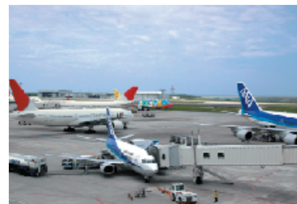
航空機で混雑する那覇空港のエプロン