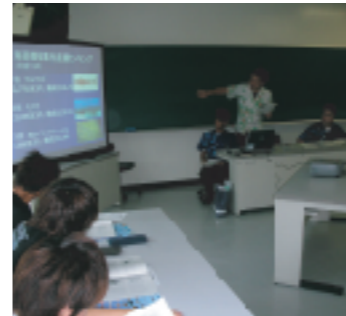
※「申込書」は、県広報課で、または、県のホームページからもダウンロードできます。

講座を希望する日の一カ月前までに「申込書」に必要事項を記入の上、県広報課まで、お申し込みください。