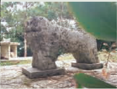
照屋のもう一頭の石獅子

井上ひで男(いのうえひでお)プロフィール フリー写真家 1963年大分県大分市出身。1995年沖縄に移住し、県内各地の祭りや石獅子を中心に撮影。