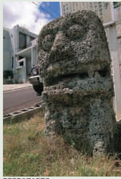
南風原町本部の石獅子