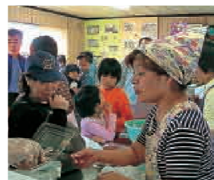
平良漁協婦人部直売店うみんちゅ

伊計島で、料理や貝細工、パパイヤやらっきょうの収穫、山羊や鳥類とのふれあいといった各種体験を提供する民宿を運営しています。