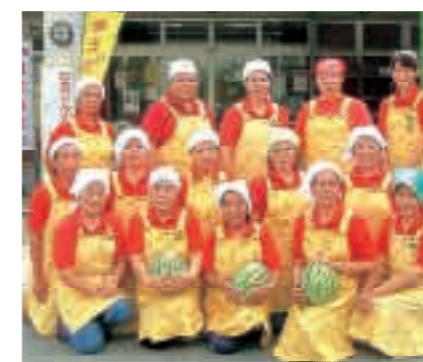
今帰仁の駅そーれ

近海産物などの海産物や惣菜(てんぷら)などを販売しています。宮古の海人が漁獲した新鮮な魚やもずくが特産品として好評を得ています。